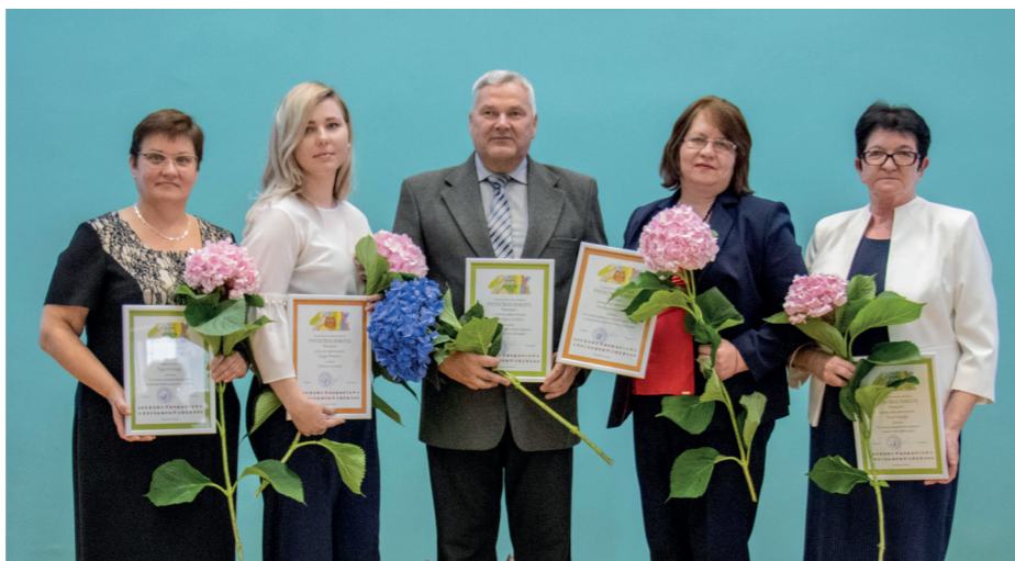
2. PAKĀPES APBALVOJUMS DAUGAVPILS BŪVNICĪBAS TEHNIKUMA PATEICĪBAS RAKSTI "MAZĀ PŪCE"

Šogad izvirzot nominācijām tika iesniegti 143 pieteikumi, no tiem 68 pieteikumi, kuros apbalvojumam tika izvirzīti pedagogi, 75 pieteikumi – tehnikuma darbinieki. Vērtēšanas komisijai apkopojot visus pieteikumus un tos izvērtējot tika piešķirti apbalvojumi