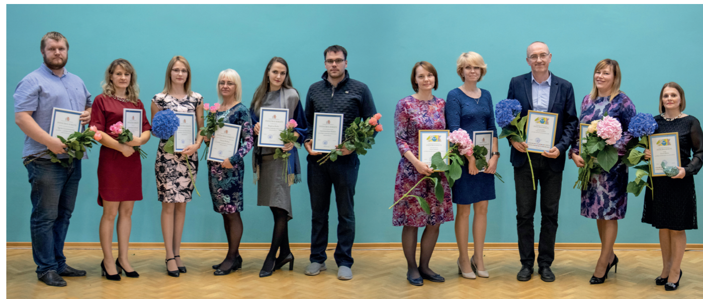
2. PAKĀPES APBALVOJUMS DAUGAVPILS BŪVNICĪBAS TEHNIKUMA PATEICĪBAS RAKSTS

Zinoša, vispārējās vidējās izglītības skolotāja. Mērķtiecīgi organizē mācību procesu, nodrošinot labvēlīgu mācību vidi. Prot rast piemērotus risinājumus dažādās situācijās, izmantojot profesionālo pieredzi. Augsti rādītāji valsts valodā. Par ieguldīto darbu jaunas paaudzes mācīšanā un audzināšanā, par prasmi darīt savu darbu ar rūpību, pacietību un mīlestību.